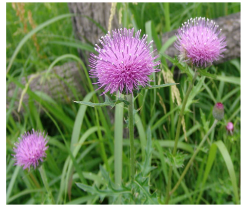
写真は 上からモウセンゴケ 下左から イシモチソウ トキソウ ノアザミ です。

群落は春まっさかりです。貴重な植物が自生している湿原で、1920年に国の天然記念物に指定されたところです。観察会の頃には トキソウやノアザミが咲き乱れています、食虫植物のモウセンゴケやイシモチソウには虫を捕らえているのがみられるでしょう。